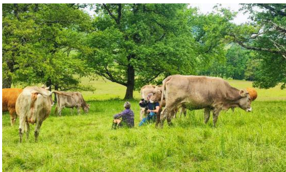
Exemple d'élevage dans les Pyrénées Ariégeoises

Le modèle EFSA a bien été recalibré sur les données démographiques réelles de la Grèce et de la Bulgarie pour tenir compte des tailles et localisations des élevages, mais les paramètres fondamentaux de transmission restent ceux issus d'Israël . L'EFSA elle-même reconnaît que cette hypothèse constitue un scénario « pire cas » pour le sud-est de l'Europe en raison des différences climatiques.