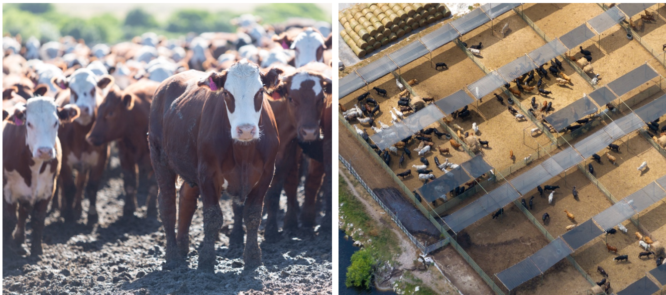
Exemples d'élevage intensif

Une telle configuration n'a rien de comparable avec la réalité des territoires de montagne français . En Ariège, on compte environ 1 000 petits élevages pastoraux dont la taille moyenne oscille entre 70 et 80 bovins par exploitation. Ces élevages sont très dispersés dans un relief accidenté et pratiquent une forte transhumance estivale sur les estives. La Haute-Savoie présente un profil légèrement différent avec une dominance des bovins laitiers, mais elle reste marquée par des systèmes extensifs en altitude, une dispersion importante des troupeaux et des contraintes topographiques identiques.